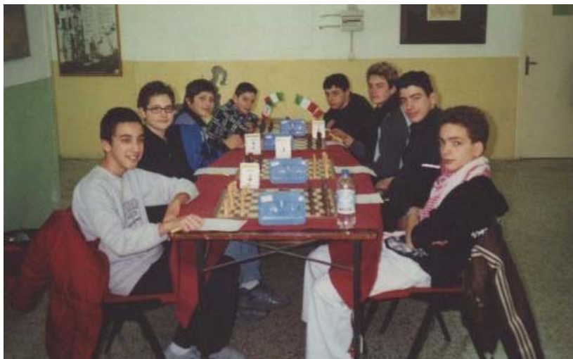
A SINISTRA LA SQUADRA JUNIORES DI LIVORNO; A DESTRA LA SQUADRA JUNIORES DELL'ELBA

PORTOFERRAIO. Si sta concludendo il 5° campionato elbano.