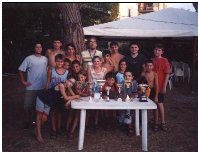
La premiazione nella sede del Club del Mare

MARINA DI CAMPO. Si è concluso a Marina di Campo, nel giardino messoci a disposizione dal Club del Mare, il terzo campionato estivo giovanile di scacchi. Vi hanno preso parte ben 27 ragazzi che ogni lunedì pomeriggio, dal 30 giugno al 18 agosto, hanno rinunciato ad un pomeriggio di mare per sfidarsi a suon di colpi di torri, alfiere, cavalli e regine. E' stato una lietissima sorpresa il fatto che oltre la metà dei partecipanti siano stati bambini al di sotto degli undici anni che ancora frequentano le scuole elementari. E che piacere vederli impegnarsi per cercare lo scacco matto ad ogni costo e poi ascoltare i loro accesi commenti! Naturalmente questi giovanissimi, non avendo ancora frequentato alcun corso, non han-