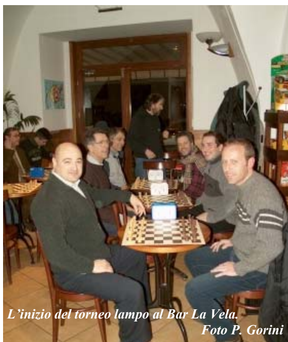
L'inizio del torneo lampo al Bar La Vela.