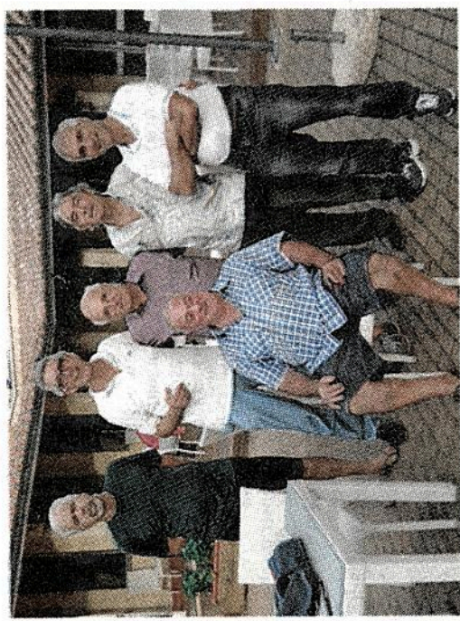
I giocatori di scacchi elbani che hanno partecipato al torneo

l'aggio Innamorata e Blu Navy che hanno permesso l'acquisto di un nuovo gozzo». A livello di statistiche da ricordare che complessivamente il canottaggio isolano - tra